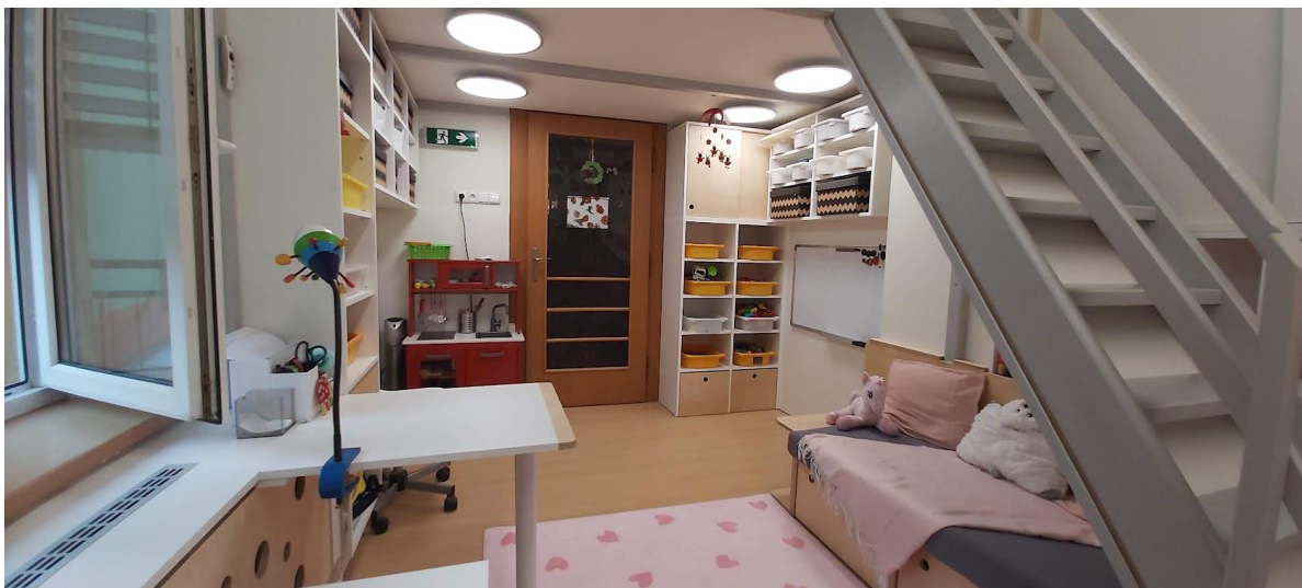
Nové vybavení třídy

Po celou dobu prázdnin byla rekonstrukce otopného systému (prostory a přístupové cesty se musely také vyklidit), dokončení v půlce září.